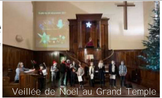
Veillée de Noël au Grand Temple

Toutes les classes d'âge se retrouvent un dimanche par mois pour une « journée KT » ; vivre le culte ensemble, puis repas (pique-nique), avant d'avoir des activités différenciées selon les âges.